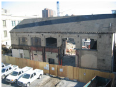
Le Coeur des sciences en restauration