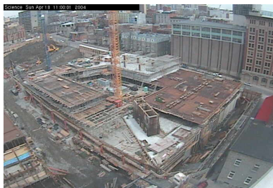
Le pavillon des sciences biologiques en devenir